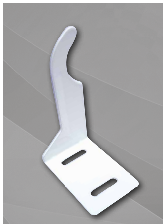
Кронштейн угловой универсальный 95x70mm